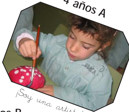
4 años A