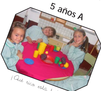
5 años A