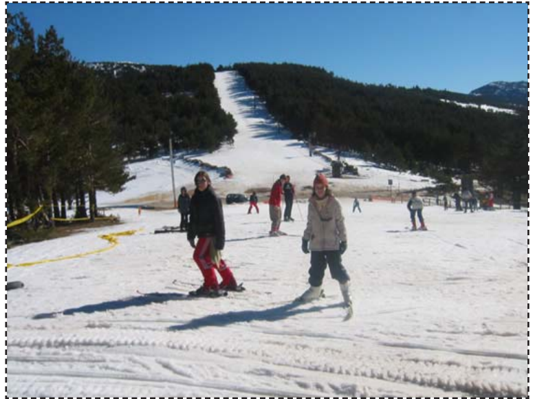
Estación de esquí de Santa Inés

El día 8 de febrero el alumnado de 6º fue al puerto de Santa Inés. 2.700 metros de altitud en un paisaje idílico, con un sol radiante rodeados de naturaleza salvaje y una frondosa vegetación cultivada de cumbres nevadas y blancas con el cielo claro y radiante. Nuestro autobús serpenteaba por la estrecha carretera, nuestros corazones cultivaban y esperaban el aterrizaje en los soñados esquís. Por la mañana hicimos esquí de fondo y por la tarde esquí al pino. Todos volvimos a Ólvega a las 18:00 horas. Nos lo pasamos muy bien.