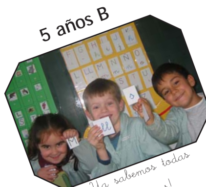
5 años B